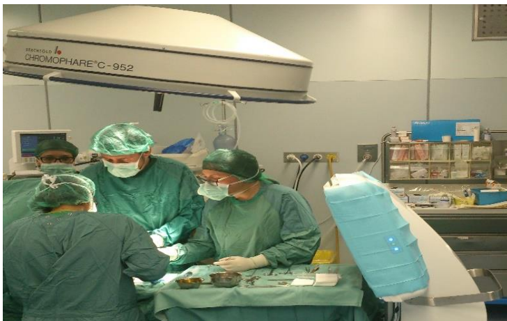
Upgrade bestehender OP Säle , Ausweitung des ambulanten Operieren - mit steriler Abdeckung - keine Turbulenzen

-Ideal für ältere Operationssäle mit zu kleiner Zuluftdecke